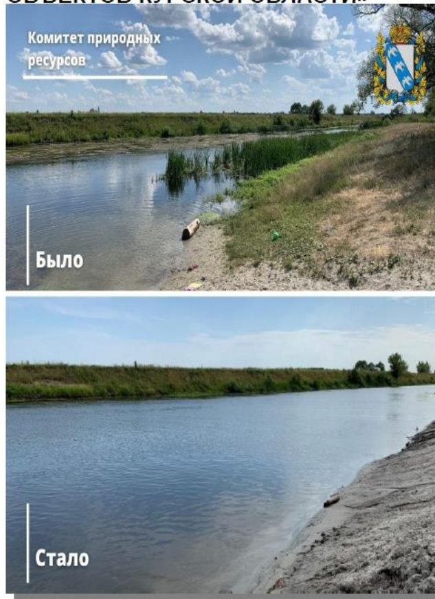
Участок реки Сейм до и после расчистки

В 2020 году завершены работы по экологической реабилитации русла реки Сейм протяженностью 17 км, в том числе и в границах г. Курска. Данные мероприятия проходили в рамках реализации федерального проекта «Сохранение уникальных водных объектов» национального проекта «Экология».